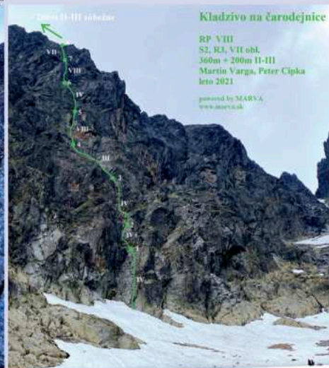
Kladzivo na čarodejnice