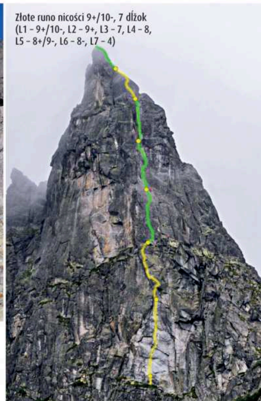
Zlote runo nicości 9+/10-, 7 dĺžok (L1 – 9+/10-, L2 – 9+, L3 – 7, L4 – 8, L5 – 8+/9-, L6 – 8-, L7 – 4)