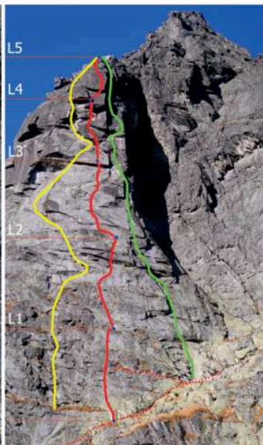
▲ Volia veža, žltá – Kývala, Orolin, Zeitler červená – Medviď – Pleidel, 2019, 5 dĺžok (L1 – 6+/7-, 25 m, L2 – 6+/7-, 40 m, L3 – 8 A1, 40m, voľne cca 9+/10-, L4 – 6 A1, 40 m, voľne cca 8 – 9, L5 – 7 – 30 m ) zelená – Estok, Janiga