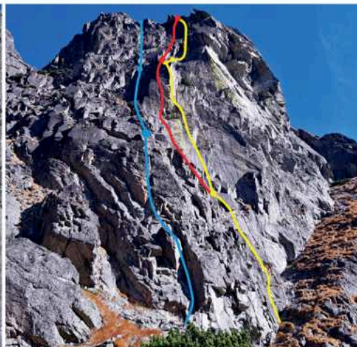
▲ Veľká Lomnická veža, modrá – Zárez, červená – Stargate, žltá – Začiatok príbehu 8 – RS1 (6+ cestou Stargate, 8-, 8-).