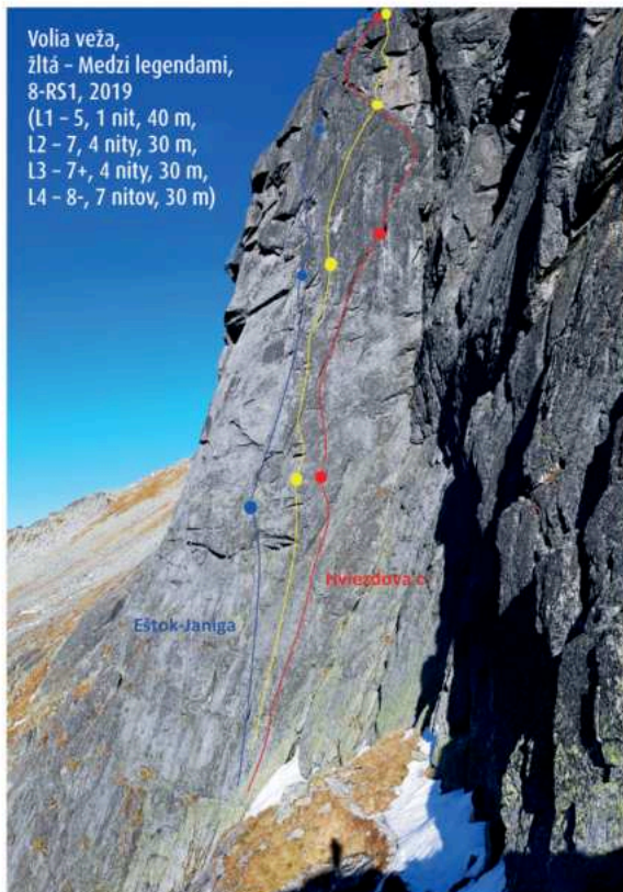
Volia veža, žltá – Medzi legendami, 8-R51, 2019 (L1 – 5, 1 nit, 40 m, L2 – 7, 4 nity, 30 m, L3 – 7+, 4 nity, 30 m, L4 – 8-, 7 nitov, 30 m)

V JZ stene Veľkého kostola vyliezli 27. 10. Maciej Bogdan a Daniel Pipieň novú cestu Wortgottes 6, 3 dĺžky lezenia.